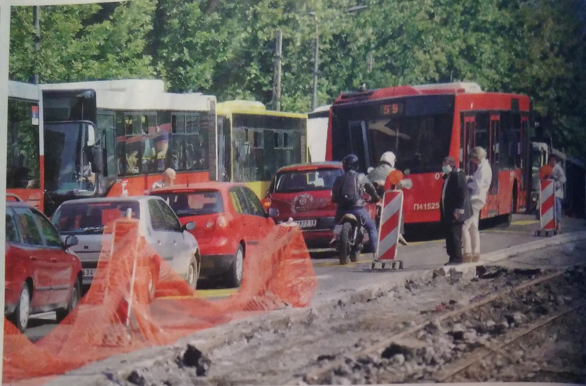
Аветињски превоз: Већ месец дана полиција не успева да пронађе возача градског превоза који је повредио две жене усред дана, 16. октобра, у центру Београда